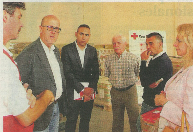
Un instante de la visita al almacén donde Cruz Roja clasifica los alimentos.

En esta primera fase, el Gobierno de España ha adquirido 96,4 mi-