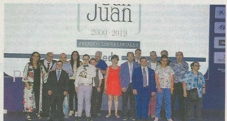
Imagen de la pasada edición de los Premios San Juan de FEDA.

La convocatoria se llevará a cabo con el compromiso de las instituciones y entidades que forman parte de elenco de colaboradores de los Premios Empresariales San Juan: CaixaBank, BBVA, Banco Sabadell,